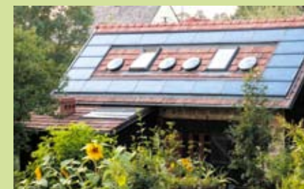
Domek z gliny i słomy z instalacją umożliwiającą wykorzystanie energii słonecznej do ogrzewania pomieszczeń