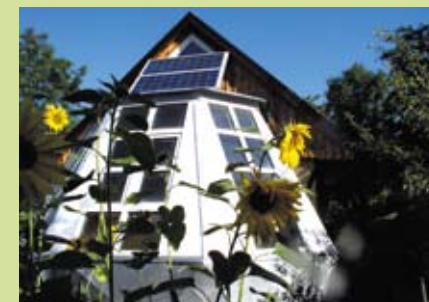
Budynek z gliny i słomy zasilany energią słoneczną